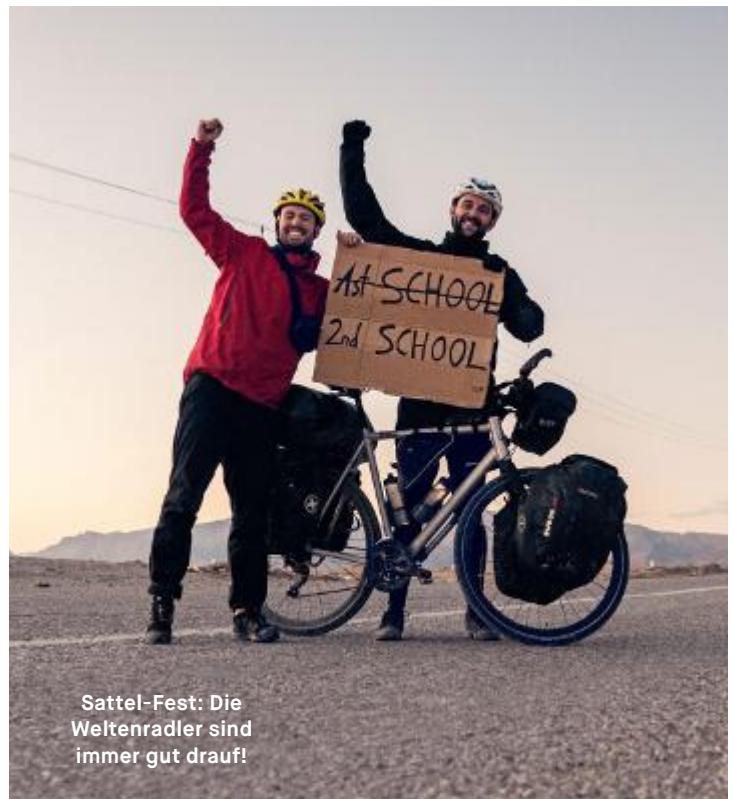
Sattel-Fest: Die Weltenradler sind immer gut drauf!