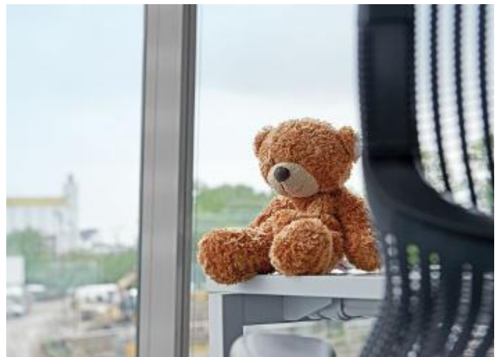
Kein Teddy-Talk: Der Prototyp fürs sprechende Kuscheltier erinnert Cognigy an früher.

„Der Teddy sollte zum Beispiel Happy Birthday singen und sich mit mir unterhalten können. Also haben wir Techies uns hingesezt und angefangen, selbst zu coden.“